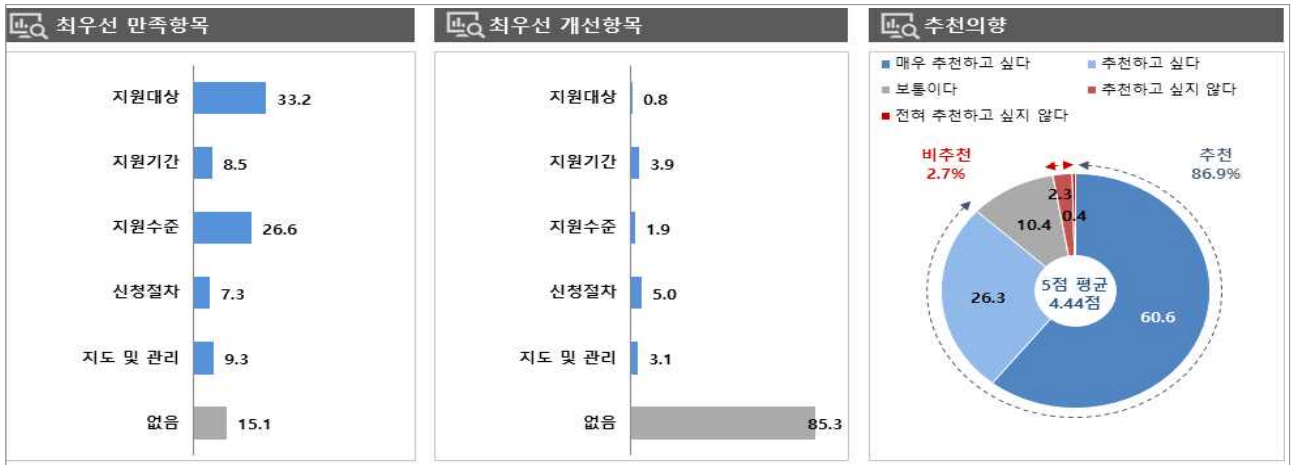
[그림 1] 고교 취업연계 장려금 지원 사업 만족/개선 항목 및 추천 의향

주: 1) 만족항목 - 전체: 지원대상(28.8) > 지도수준(16.9) > 지도/관리(10.3) > 지원기간(9.8) > 신청절차(9.1) ; 없음(25.1) - 창출: 지원대상(31.3) > 지원수준(26.0) > 지도/관리(11.1) > 지원기간(8.6) > 신청절차(6.5) ; 없음(16.5) 2) 개선항목 - 전체: 신청절차(8.6) > 지원기간(5.9) > 지원수준(4.8) > 지원대상(3.7) > 지도/관리(3.1) ; 없음(74.0) - 창출: 신청절차(5.6) > 지도/관리(4.4) > 지원기간(3.7) > 지원수준(2.6) > 지원대상(0.5) ; 없음(83.3) 3) 추천 의향 - 전체: 4.29점, 추천(81.9=31.4+50.5) > 보통(15.4) > 비추천(2.7=2.1+0.6) - 창출: 4.44점, 추천(86.5=25.5+61.0) > 보통(10.7) > 비추천(2.8=2.3+0.5)